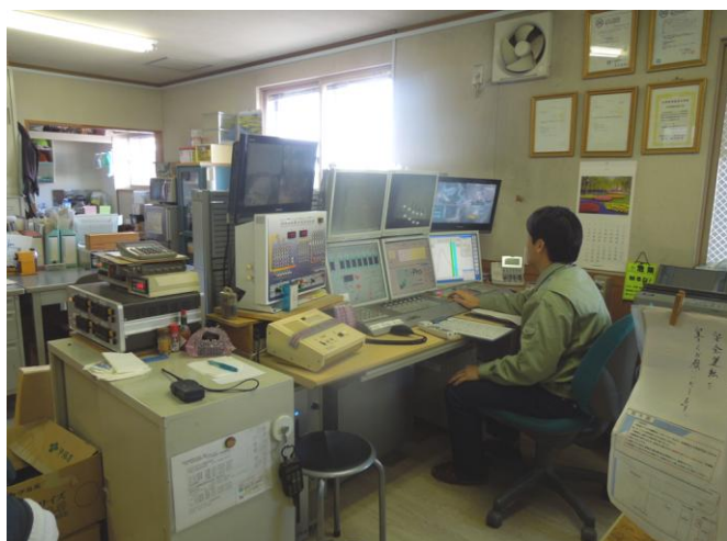
生コンクリート生成・出荷のコントロールをしています。