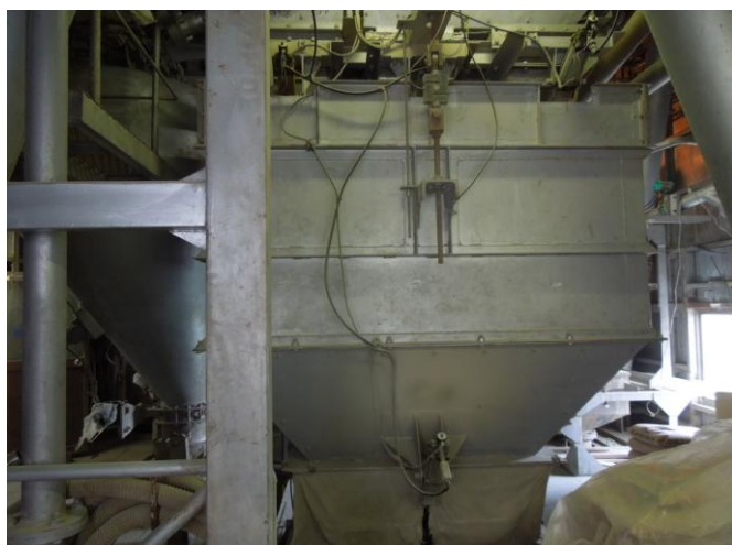
骨材の計量ビンです。