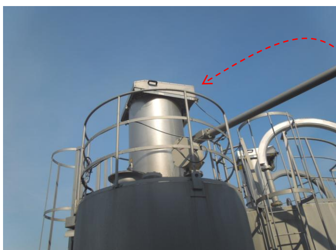
セメント貯蔵庫に付いている脱気システムです。