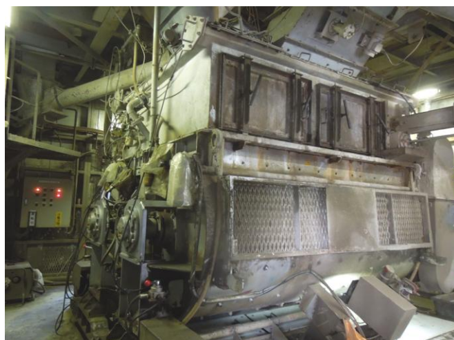
練りミキサーです。