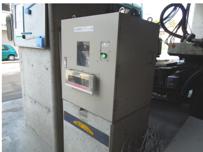
作られたコンクリートが、誤送されないように伝票に車体番号と行き先が記されています。