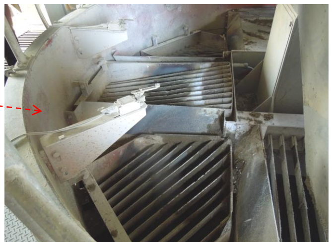
細骨材・租骨材それぞれ3か所の貯蔵庫に分けられます。