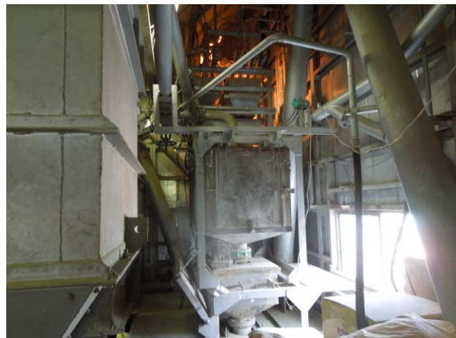
セメントの計量ビンです。