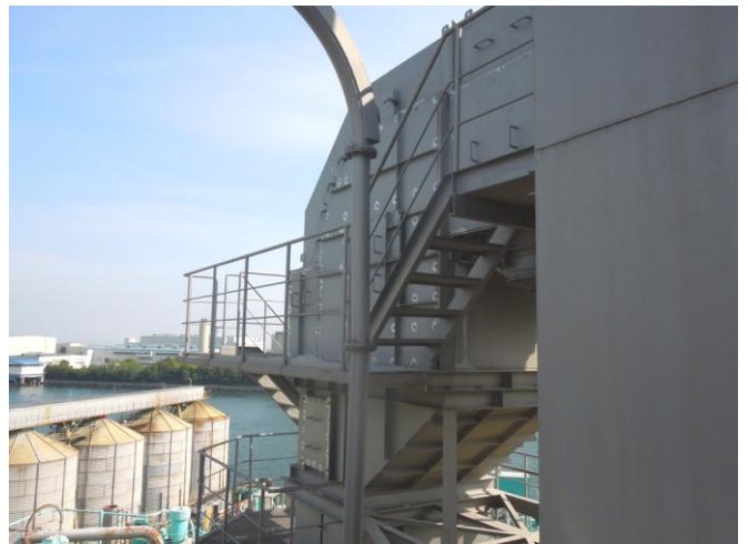
横から見た垂直ベルトコンベアです。