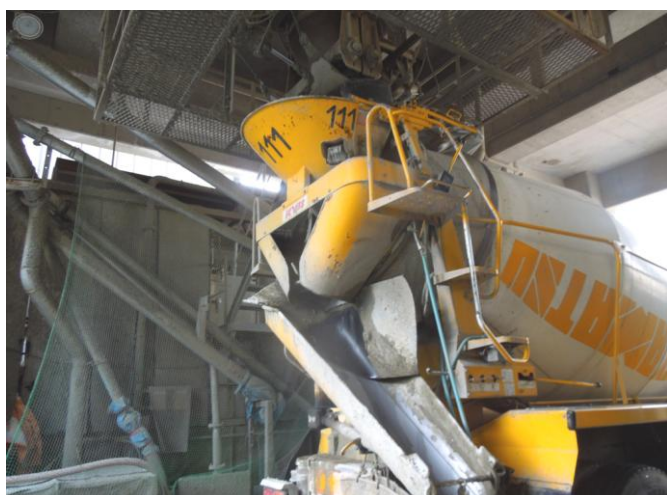
作られたコンクリートを、ホッパーからミキサー車に積み込みます。