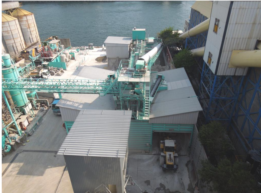
海から船を横付けして、骨材を搬入します。