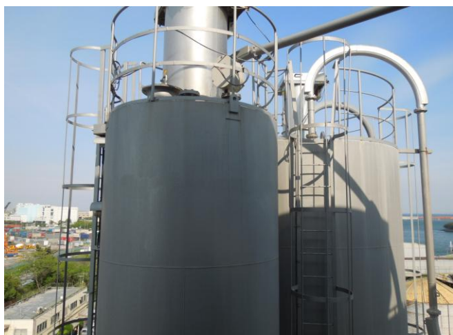
セメントの貯蔵庫です。