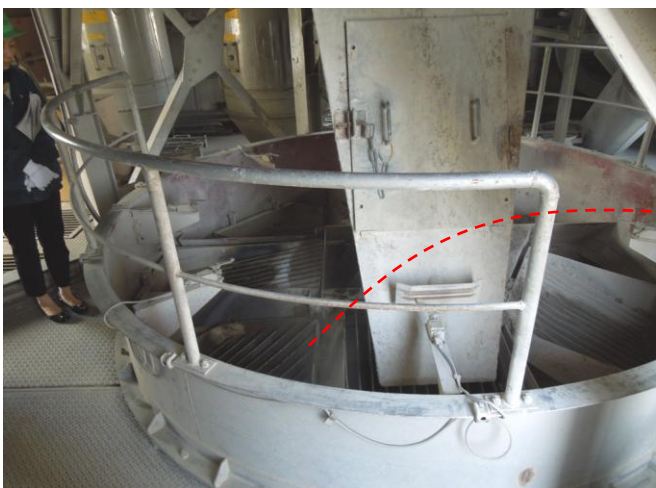
骨材の振り分けをします。